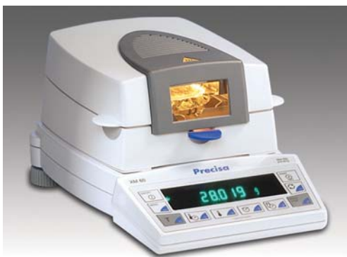
Robust und einfach zu bedienen