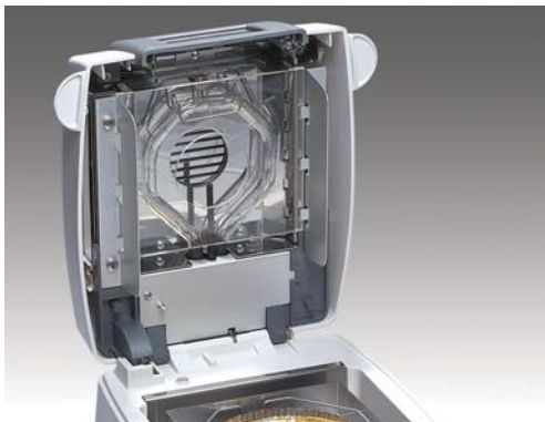
3 verschiedene Heizelemente wählbar