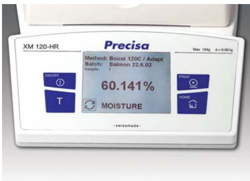
Hervorragendes Touch Screen Display