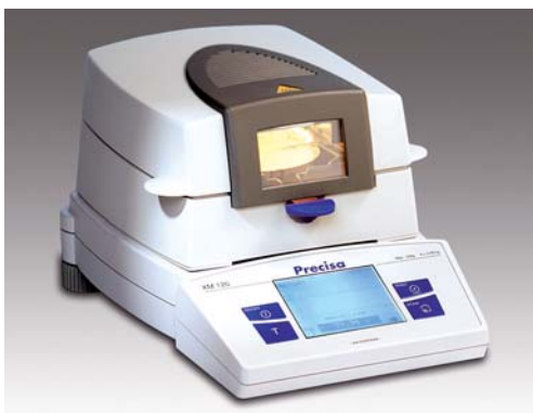
Elegante kompakte Bauform